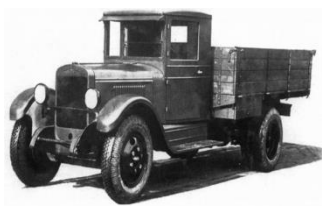
Советский грузовик ЗиС-5