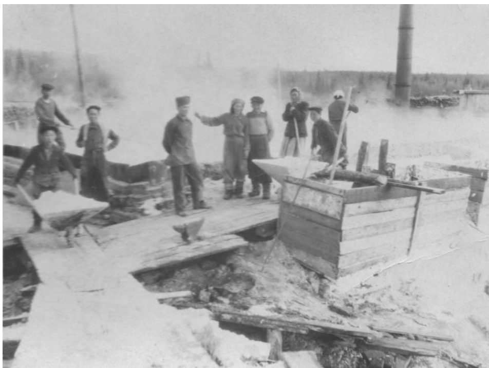
Корпус курорта автономного управления, здание 1925 года построения