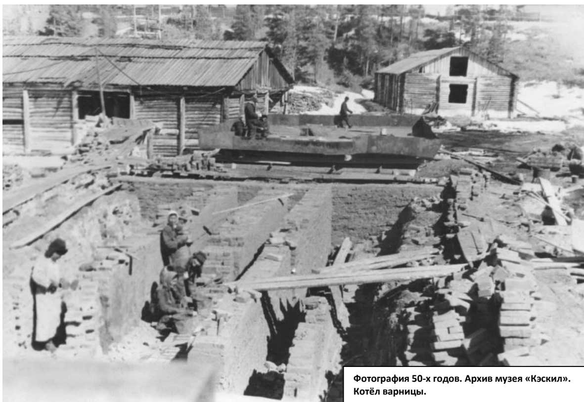
Фотография 50-х годов. Котёл варницы.

В тяжелые годы начального этапа войны героически трудились рабочие сользавода