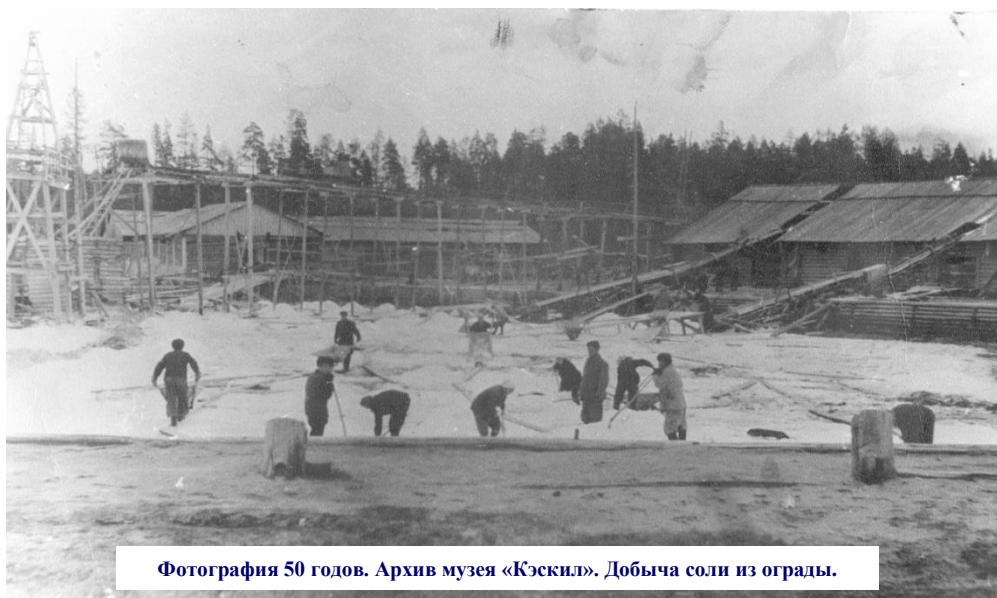
Фотография 50 годов. Добыча соли из ограды.

остро стоит вопрос о кадровых работниках, их крайне мало. Этот вопрос надо будет решить в ближайшем будущем».