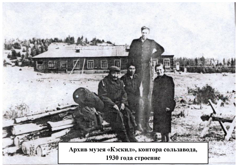
контора сользавода, 1930 года строение

Выдержка из докладной А.В. Евсеева секретарю Президиума Верховного Совета ЯАССР т. С.П. Сидоровой (перевод с якутского языка): «В моей бригаде работает 8 человек, из них 7 – стахановцы, это Николаев И.И. превышает дневную норму в 200 – 230%, Янторусов Е. выполняет план на 200 – 300%, Терянов Е.С. на 200 – 250%, Кондратьев А. на 200 – 250%, Спиридонов С. на 200 – 300%. В июне месяце мы выполнили план добычи соли из ограды на 111%, добыв в место запланированных 1200 тонн 1335 тонн. По выварке соли за 5 месяцев план выполнили 113,3%, выварив вместо запланированных 3000 тонн 3400 тонн. Мы за 5 месяцев два раза заняли 3 место во Всесоюзном социалистическом соревновании. Главным недостатком завода является: нехватка автомашин. Автомашин, которые есть, уже устарели, также не хватает запчастей для них. Очень