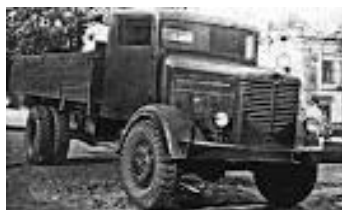
Советский грузовик ГАЗ-ААА